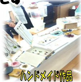
ハンドメイド作品

古着、おもちゃ、キッズ用品、ベビーグッズ、布小物、 折り鶴アクセサリ、ハンドメイド作品 etc