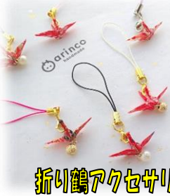
折り鶴アクセサリ