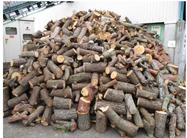
針葉樹（発酵場3の後ろにあります。）