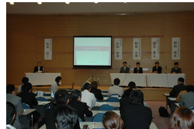
↑パネルディスカッション(コーディネーターとパネラー)