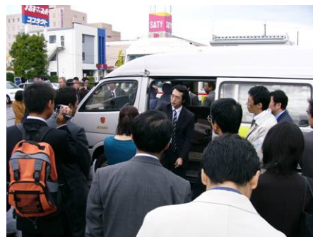
↑屋外でのデモンストレーション