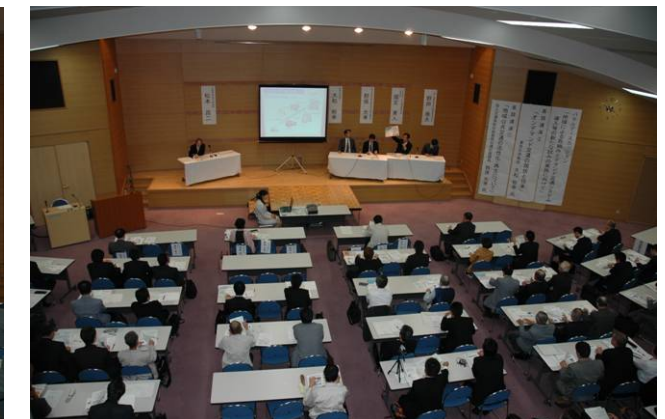
↑パネルディスカッション(会場全景)