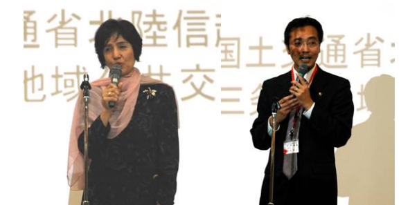
↑北陸信越運輸局長挨拶