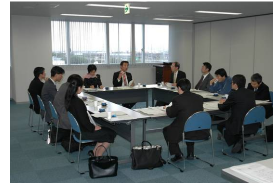
←開始前のディスカッション