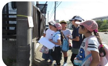
【スポーツカーニバル】