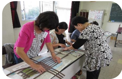
【クラフトバンドで作るカゴバッグ】