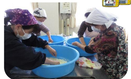
【はじめてのみそ作り】