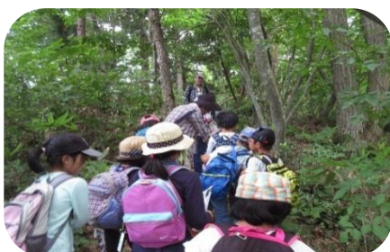
【チャレンジクラブ】

きっず！楽しくクッキングは、ちぎりパンなどを作りました。 チャレンジクラブは、しらさぎ森林公園を散策しました。 ほのほのもちつき体験は、臼と杵でもちをついて食べました。 書き初め練習教室は、24人が参加して熱心に練習しました。 スポーツカーニバルは、みんなで相談して、ウォークラリーの問題を解きました。