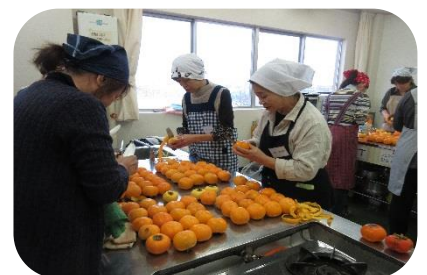
【干し柿づくり講座】