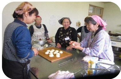
【はじめてのパンづくり】