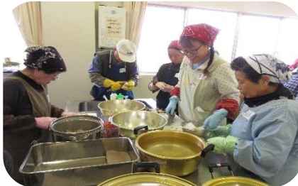
【はじめての手作りコンニャク】