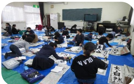
【書き初め練習教室】