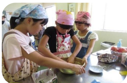
【きっず！楽しくクッキング】