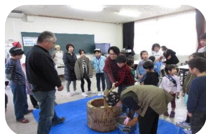
【ほのほのもちつき体験】

きっず！楽しくクッキングは、ちぎりパンなどを作りました。 チャレンジクラブは、しらさぎ森林公園を散策しました。 ほのほのもちつき体験は、臼と杵でもちをついて食べました。 書き初め練習教室は、24人が参加して熱心に練習しました。 スポーツカーニバルは、みんなで相談して、ウォークラリーの問題を解きました。