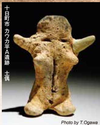
十日町市カワクラ平A遺跡 土偶