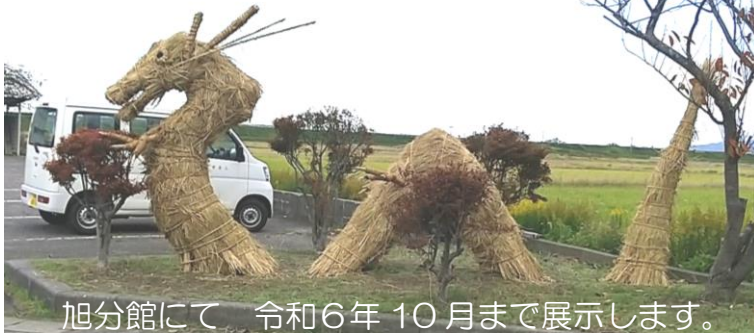
旭分館にて 令和6年10月まで展示します。