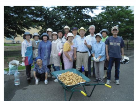
昨年度の「光庭 de プチ・ファーム」の様子