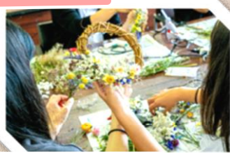
ハーフクラブ講座