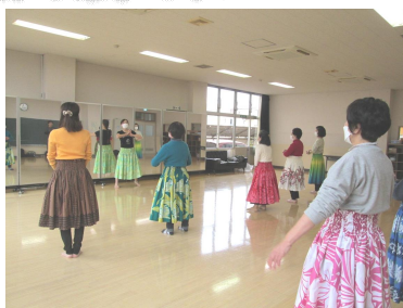
初めてのやさしいフラダンス講座