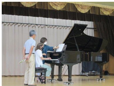
輝くシニアピアノ体験講座