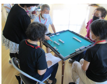
健康マージャン教室