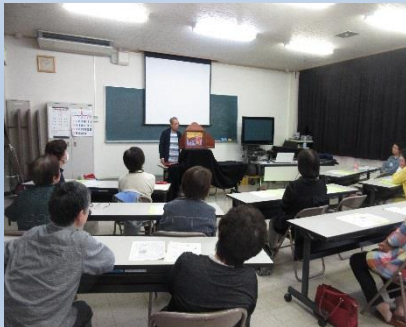
ときめき成人講座