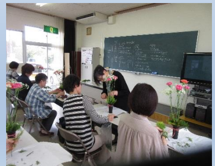
フラワーアレンジメント入門教室