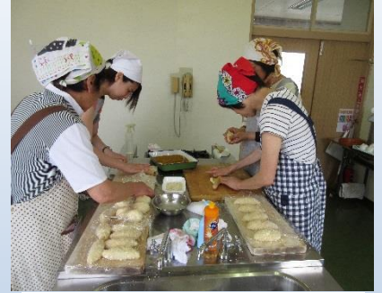
はじめてのパンづくり