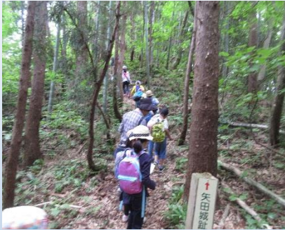
チャレンジクラブ