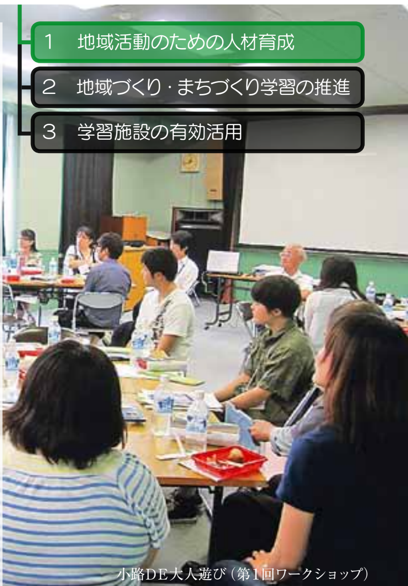
小路DE大人遊び（第1回ワークショップ）