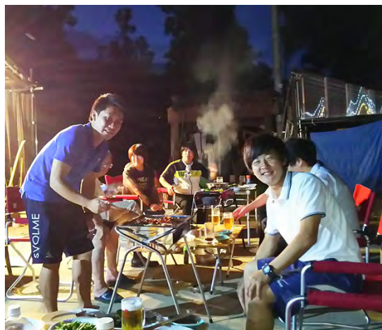
お世話になった方達とバーベキュー大会!

の心を強く持つている事です。ご近所の皆さんや嵐渓荘の皆さん、そして私たち地域おこし協力隊にとって掛け替えのない存在になったのは、この人柄があったからだと思えます。2人