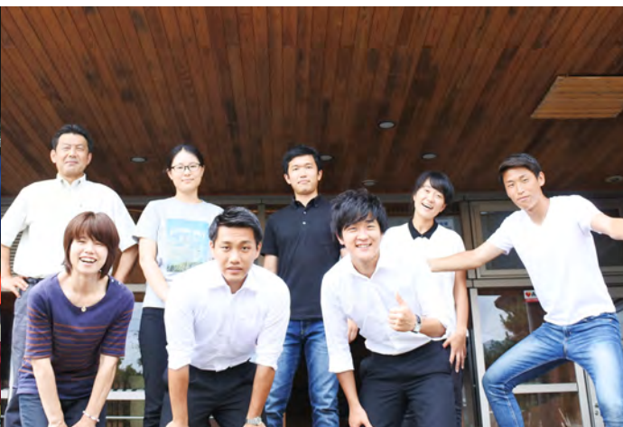
地域おこし協力隊との集合写真。共に成長できました。