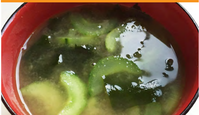
本日のお題「おばけきゅうりのお味噌汁」