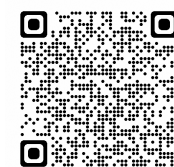
市民総合窓口予約