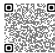
市民総合窓口予約

市民総合窓口で手続きを行う方は、三条市ホームページからスマートフォンやパソコン、電話（住所異動予約専用 ☎050-1809-3465）で予約が可能です。 栄・下田サービスセンターでの手続きは予約不要です。 詳しくは、三条市ホームページをご覧ください。