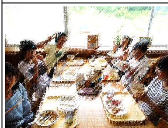
妙高自然の家の食事はバイキング形式です。