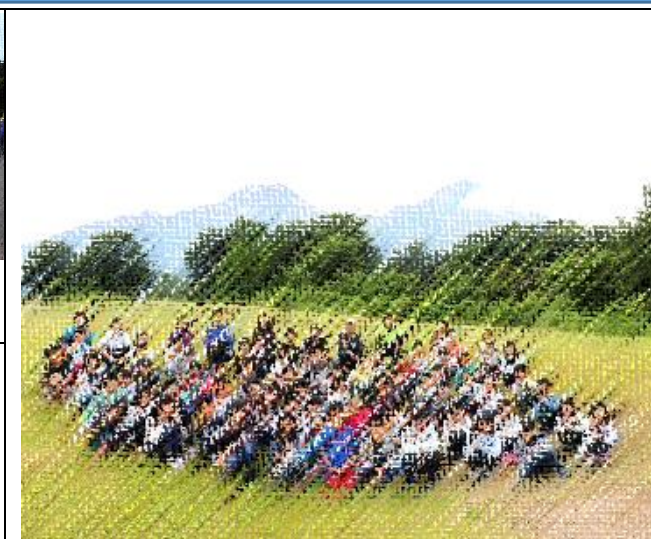
しただの郷学園5年生全員集合