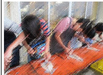
イカを包丁で裂いて「一夜干しスルメ」作り体験