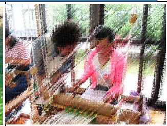
ぎったんばったん、「裂き織り」の機織り体験。