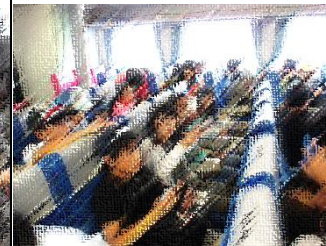
帰路はジェットフォイルであっという間に新潟到着。