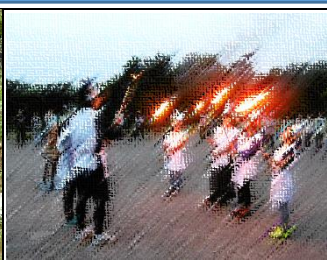
キャンプファイヤーで、火の神の前で「誓いの儀式」。