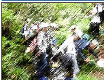
源流体験「沢登り」。冷たい水が気持ちよかったです。