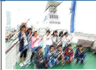
カーフェリー「おけさ丸」は快適でした。