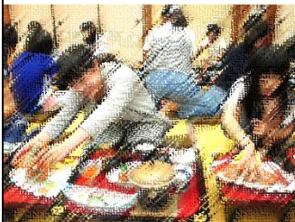
夕飯では一人に一杯のカニが出ました。