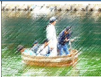
「たらい船」はなかなか前に進みません。