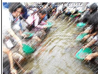
西三川ゴールドパークで「砂金採り」体験。