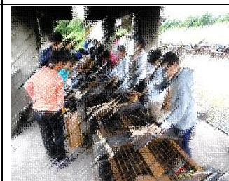
カレーライスは美味しくできたでしょうか？