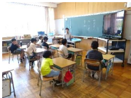
各教室で「いじめ見逃しゼロ宣言」