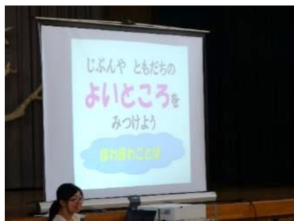
生活指導主任から全体指導