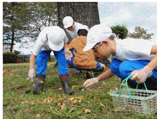
3・4年生の提案で、ギンナン集めの全校活動がスタートしました。