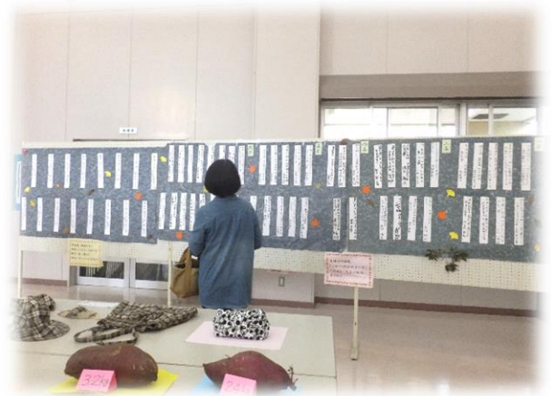
银杏祭で展示した『ふるさと標語』