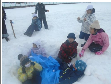
2班 最もたくさん穴を 掘ったで賞