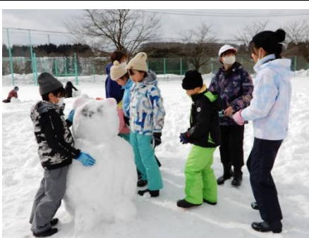
4班 みんなで仲良くシロクマを つくったで賞