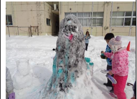
6班 最後まであきらめず カオナシを作ったで賞