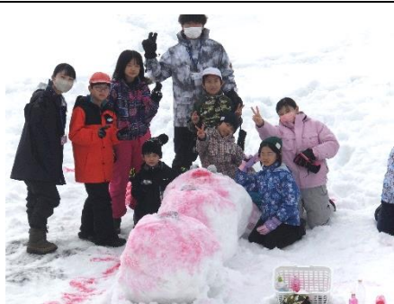
1班 かわいいうさぎ つくったで賞

縦割り班ごとに雪像づくりをしました。札幌雪祭り、十日町雪まつりに負けない趣向を凝らした雪像ができあがりしました。また、当日は、地域おこし協力隊総勢13名の皆さんから、子どもたちの活動を応援していただきました。「〇〇賞」は、地域おこしの皆さんから付けていただきました。