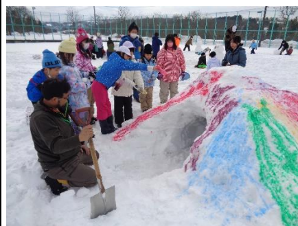
5班 みんなで協力して カラフルなかまくら作ったで賞