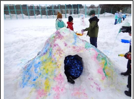
3班 カラフルなかまくらを カラフルな雪だるまが きっと見守っているで賞