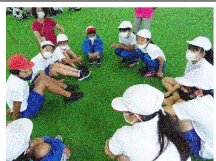
しりとりで大苦戦