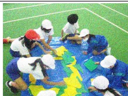
パネルを組み合わせて何作ろう