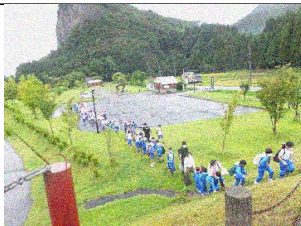
八木ヶ鼻が待っていました