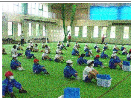
スポーツセンターはやぶさに到着