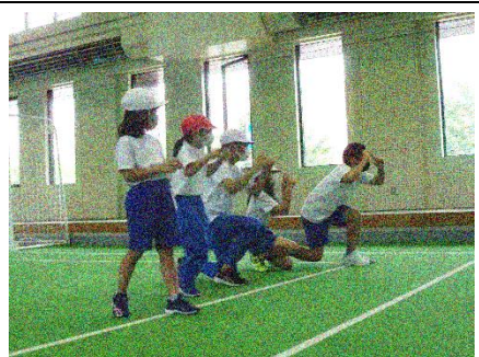
「ハイポーズ」ジェスチャーゲーム