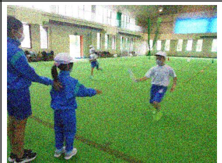
班対抗リレー大会

「リレーのときに〇〇〇さんに『はしるのはやかったね』っていわれてうれしかったです。」(1年生)