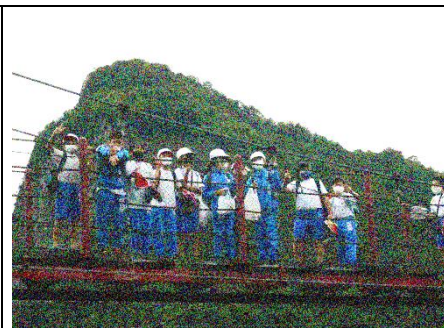
つり橋の上で記念撮影