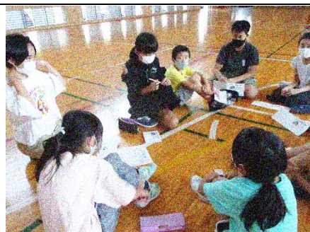
どんな活動にするかの班の相談会