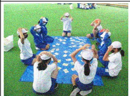
ここでも「ぴかぴかた」