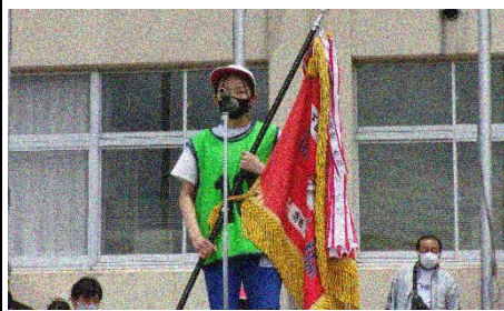
閉会式・表彰／感想発表 (赤)