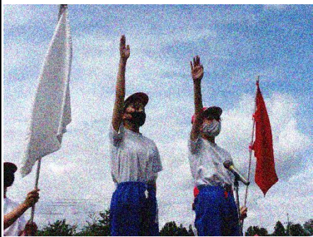
開会式・選手宣誓