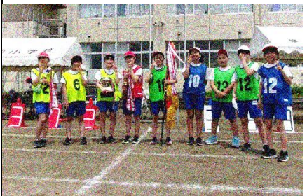
笑顔と涙の6年生全員集合

今年の全校リズムダンスは、スキマスイッチの『全力少年』です。その中にこんな歌詞を見つけました。