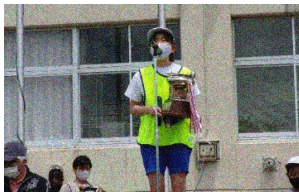
閉会式・表彰／感想発表 (白)