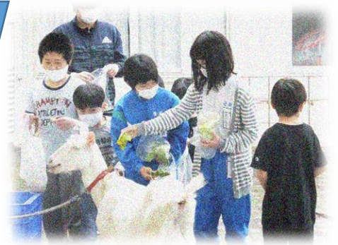
持ってきたエサをプレゼント

母ヤギ・ポンちゃんとお別れをしたはなちゃんの切なそうな鳴き声を聞いて、「はなちゃんすごく寂しそう」「我慢して」「仕方がないんだから」「ぼくたちが遊びに来てやるから」と、心を動かす子どもたちです。