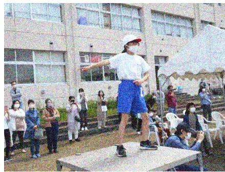
全校リズムダンス『全力少年少女』