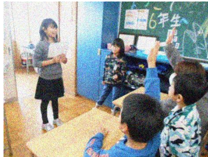
はきはきと相手に伝わる話し方で