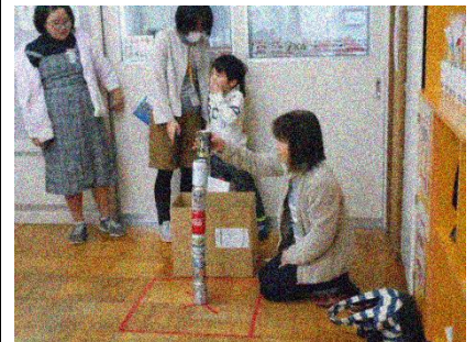
地域の方からも楽しんでいただきました