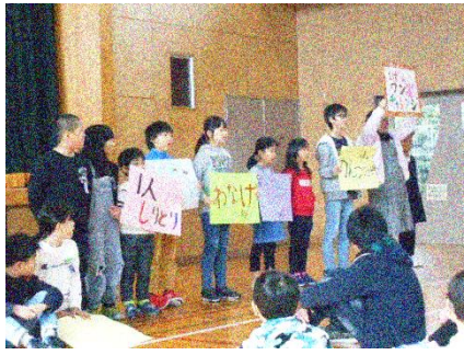
「みんな来てね」開会式でお店の紹介