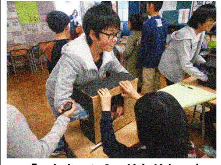
「これなーに?」どきどきです