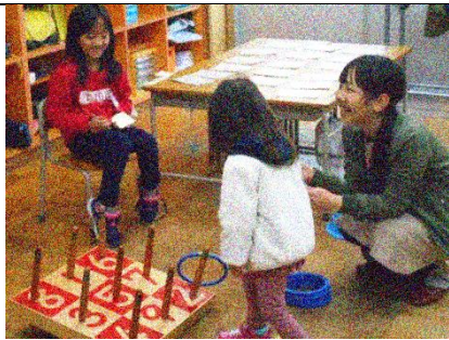
ちびっ子も楽しんでました