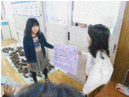
ルールの説明も大切な仕事です