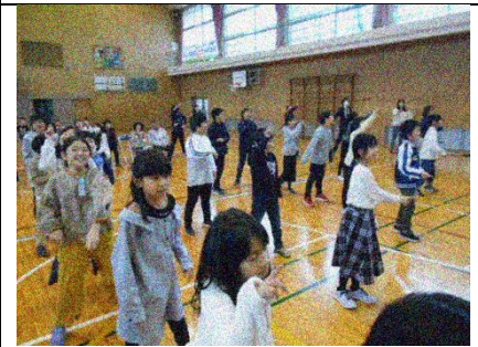
全校で楽しく踊ってフィナーレ