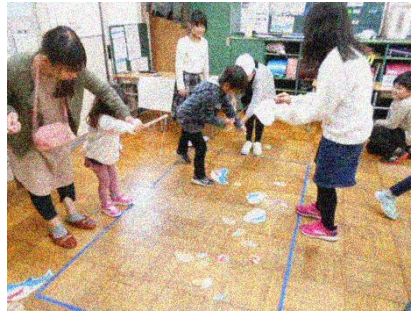
「大きな魚をねらって」魚つり