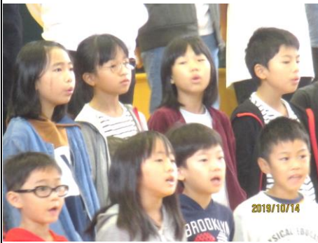
2部のハーモニーを響かせた全校合唱