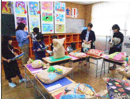
各学年の作品鑑賞