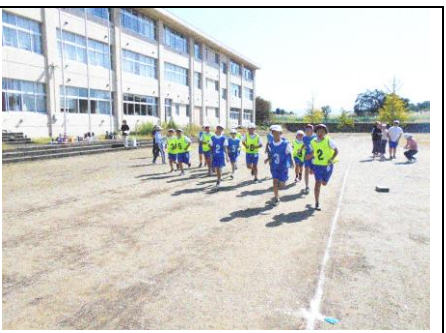
スタートダッシュ