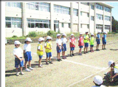
おめでとう！各学年男女優勝者