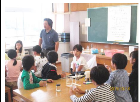
育成会の皆様からご指導いただいた体験教室