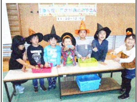
1年生の「アサガオのたね屋さん」