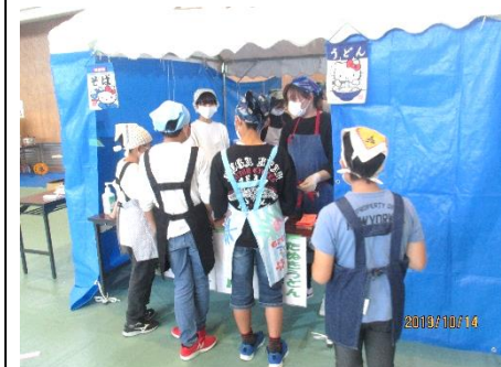
さわやかな笑顔で5・6年生がバザーのお手伝い