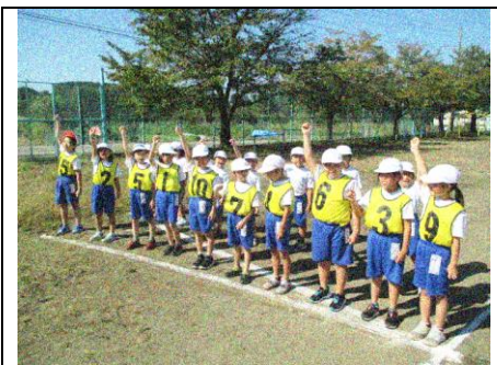
「エイエイオー！」気合いを入れる