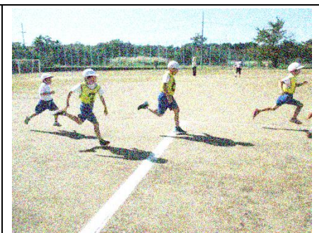
仲間と競い合って走る