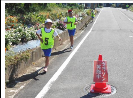
折り返し地点 あと半分