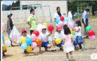
幼児：風船とりレース