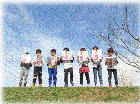
元気の丘で国語の教科書を音読