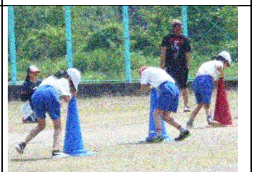
3・4年：ぐるぐる回って