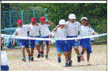
5・6年：3人4脚障害物レース