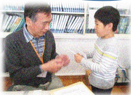
生活科・学校探検で先生に自己紹介