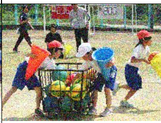
1・2年：アイスクリーム屋さんへようこそ