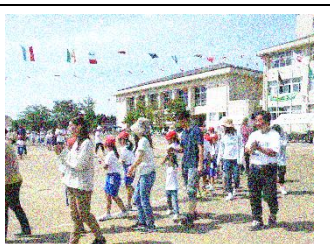
みんなで下田盆踊り