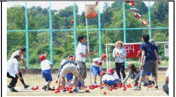
1・2年：親子で仲良く！お助け玉入れ