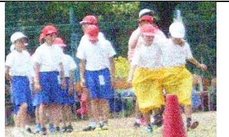
縦割り：でかパンフラフープ