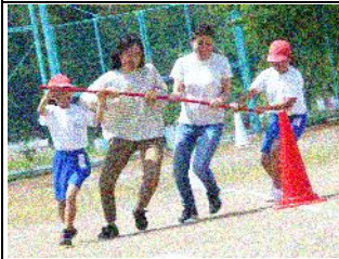
3・4年：親子 DE 大移動