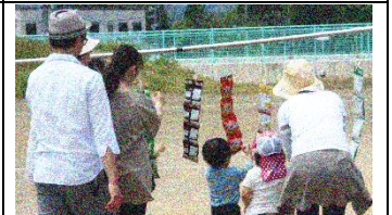
寿：お菓子をめざせレース