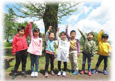
笹岡公園のイチョウの木の下で 全員集合「エイエイ、オー！」