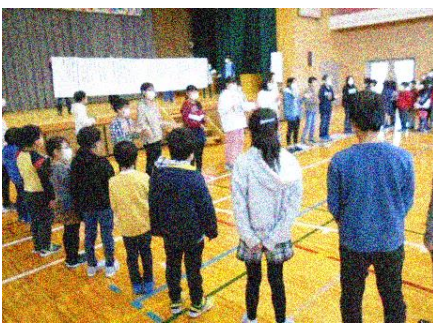
6年生への思いを込めて 5年生が考えた歌を全校で合唱