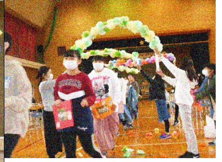
満面の笑顔で3・4年生が用意し たアーチを退場する6年生