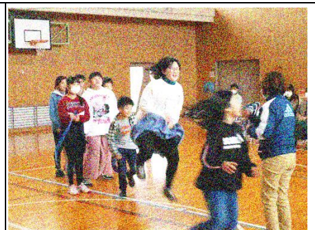
長なわとびで6年生に挑戦 やっぱり6年生にはかないません