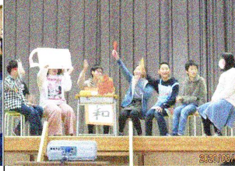
短い準備時間で用意した 全員集合の出し物を6年生が披露