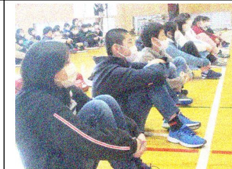
発表を見つめる6年生の姿勢に 下級生への思いやりを感じます