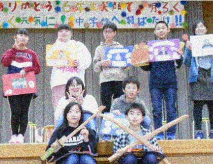
6年間一緒に生活した 大切な仲間