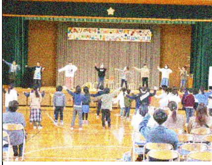
6年生の呼びかけで、 全校でリズムダンス