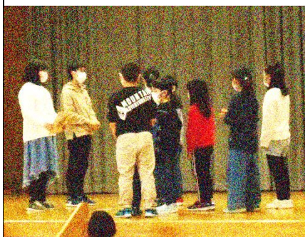
縦割り班で用意した メッセージカードをプレゼント