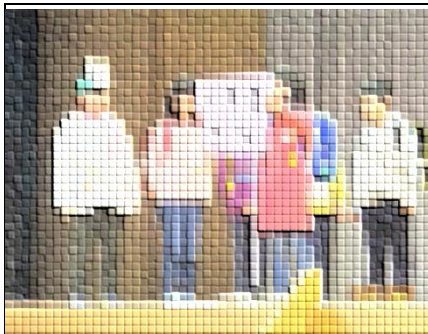
1・2年生が6年生一人一人の いいところを劇で紹介

臨時休校で予定を前倒しして行った6年生を送る会。 「大好き6年生」「ありがとう6年生」の思いを込めた 素敵な会になりました。