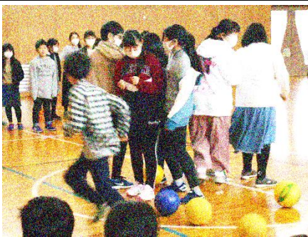
6年生 VS 在校生の 転がしドッチボール