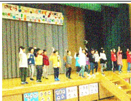
1・2年生がリズムダンスで 会を盛り上げました