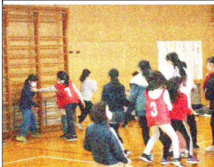
3・4年生のリードで 全校鬼ごっこを楽しみました