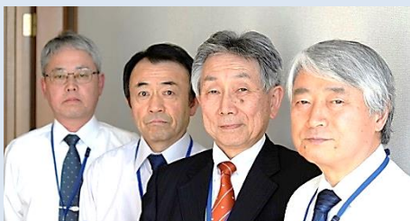
高田 算数 星野 算数 島田 社会 渡邊 理科