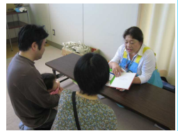
パパも一緒の方もいらっしやいます。