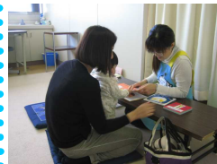
絵本に興味しんしんの赤ちゃん。

10ヵ月児健康相談会(コアラランド)の際に、図書館スタッフがブックスタートを実施しています。そのひとコマをご紹介します