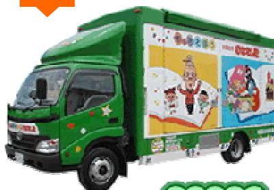
このキャラバンカーが来ます!