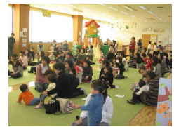
大人も子ども、楽しく見てくれています