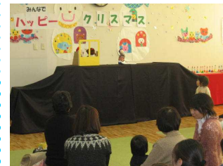
サンタさんとトナカイさんとまどのそとに!

12月25日に、すまいるランドでクリスマス会が開催されましたが、図書館からも人形劇で参加しました。「たいへん大勢のお客さまに、楽しくごらんいただくことができ、とてもうれしかったです」(スタッフ談)