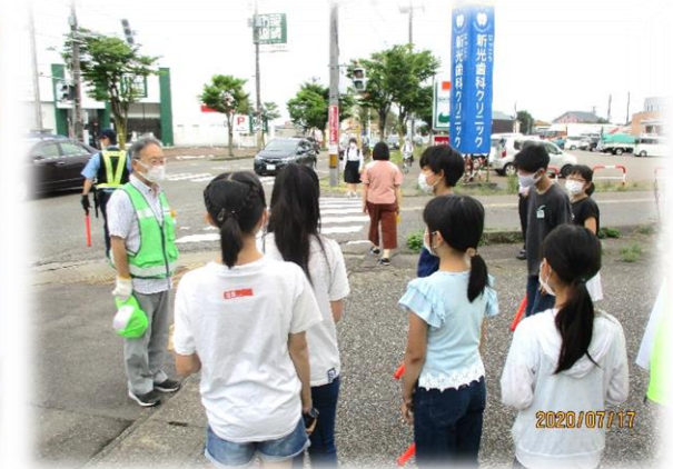
【スクールガード体験】