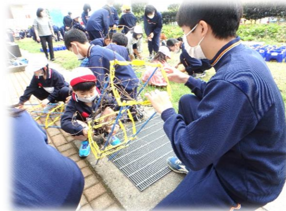
【リトルティーチャー活動】