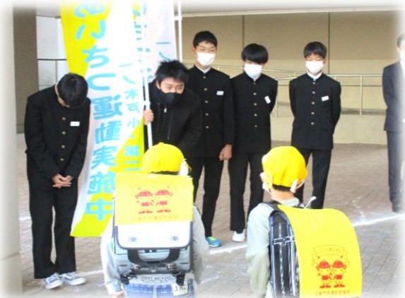
【小中合同あいさつ運動】