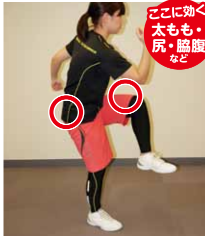
②リズムカルに連続して、左右交互に 行います。