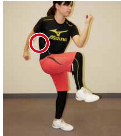
①もも上げの要領で、体をひねるように ひとひざをクロスさせ近づけます。