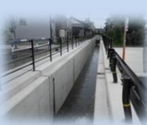
公共下水道事業 裏館第一雨水幹線工事