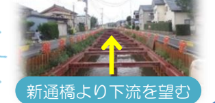
新通橋より下流を望む